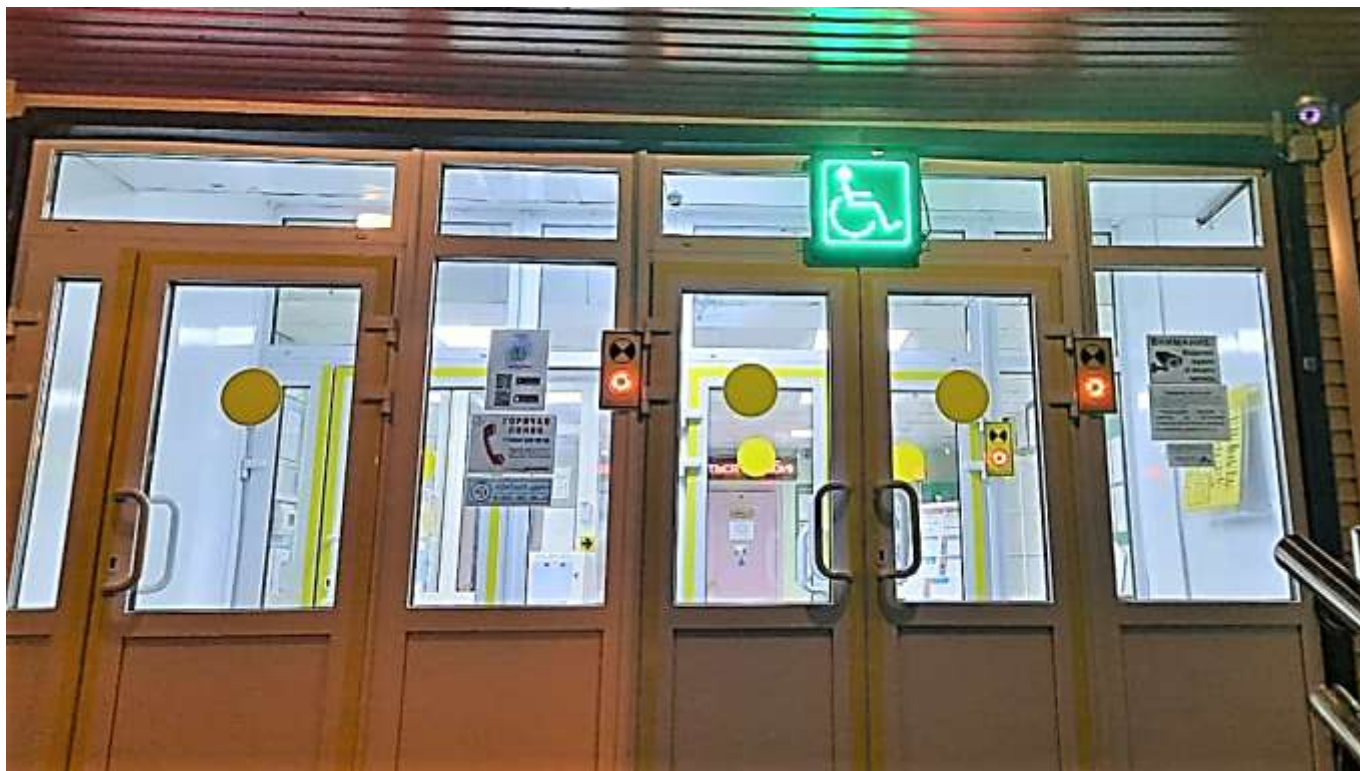
Фото 1. Главный эвакуационный выход (вид снаружи здания)

Контрастное выделение контура дверей эвакуационных выходов и оснащение учреждения световыми маяками для обозначения габаритов дверных проемов