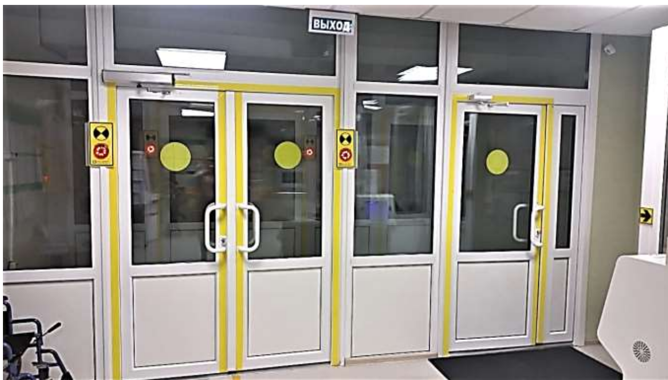
Фото 2. Главный эвакуационный выход (вид изнутри здания)