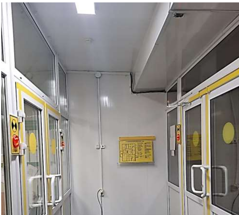
Фото 9. Мнемосхема на 1 этаже здания