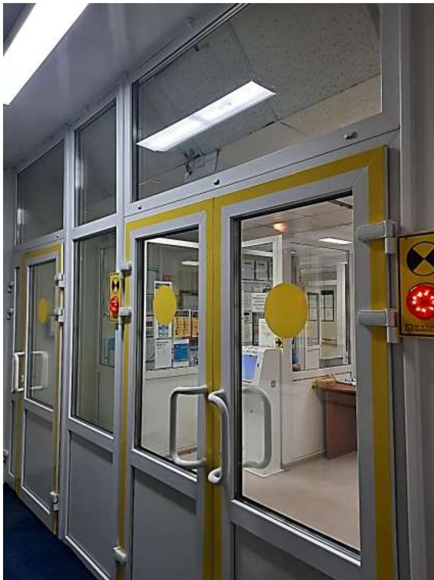
Фото 3. Главный эвакуационный выход (вид изнутри здания)