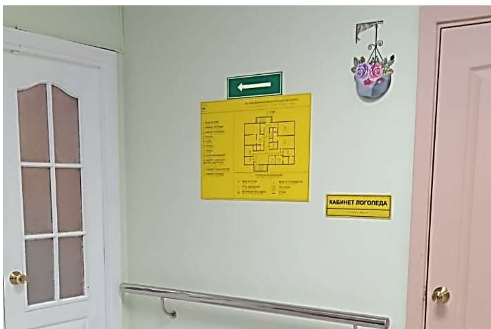
Фото 10. Мнемосхема на 2 этаже здания