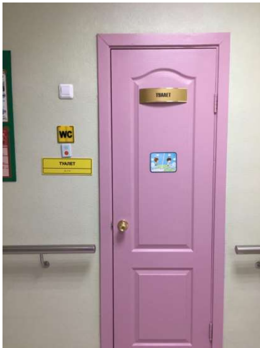
Фото 8. Таблички, обозначающие санитарные узлы