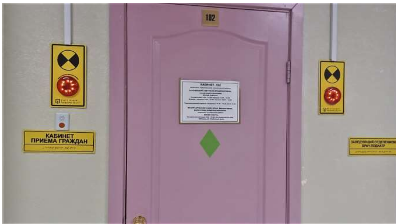
Фото 6. Таблички, обозначающие кабинеты

Оснащение учреждения табличками с названиями помещений, выполнение рельефно-точечным шрифтом Брайля