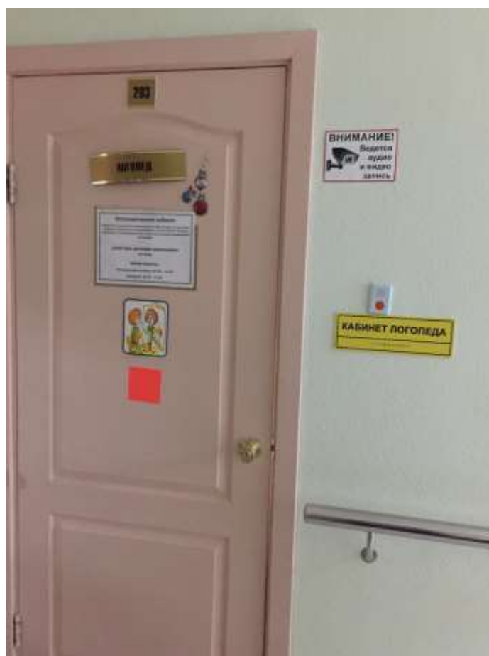
Фото 7. Таблички, обозначающие кабинеты