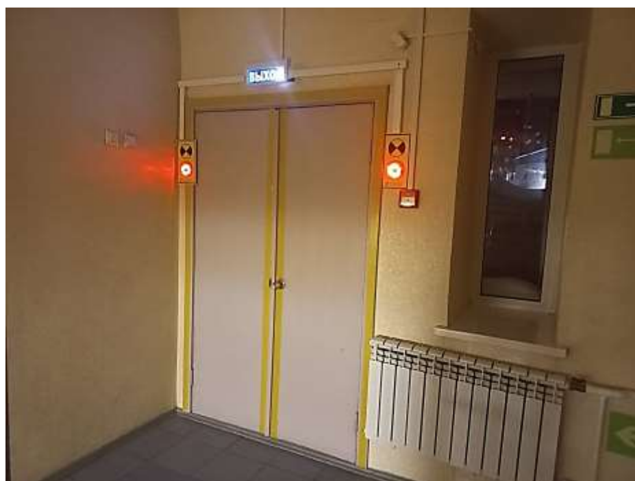
Фото 4. Запасной эвакуационный выход с левой стороны здания