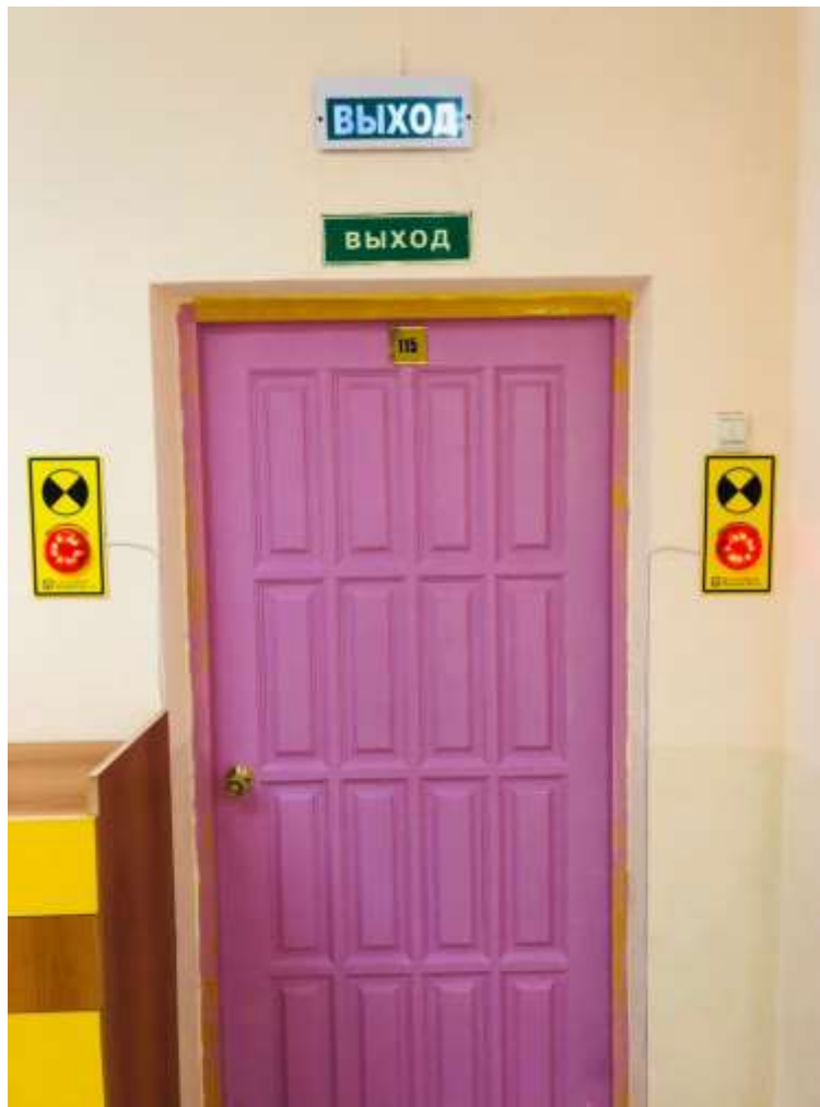
Фото 5. Запасной эвакуационный выход с правой стороны здания