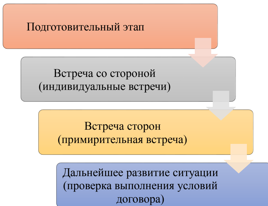
Рис. 2. Порядок работы медиатора

Запросы на проведение восстановительной программы могут поступать как по личному обращению граждан, так и из учреждений системы профилактики безнадзорности и правонарушений несовершеннолетних муниципального образования (комиссии по делам несовершеннолетних и защите их прав, органов опеки и попечительства, учреждений образования, здравоохранения и т. д.).