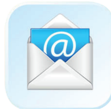
Электронная почта (E-mail)