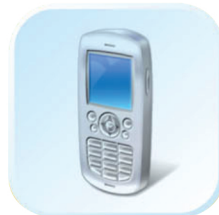
Мобильный телефон (SMS)