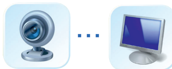
Web - камера (Skype)