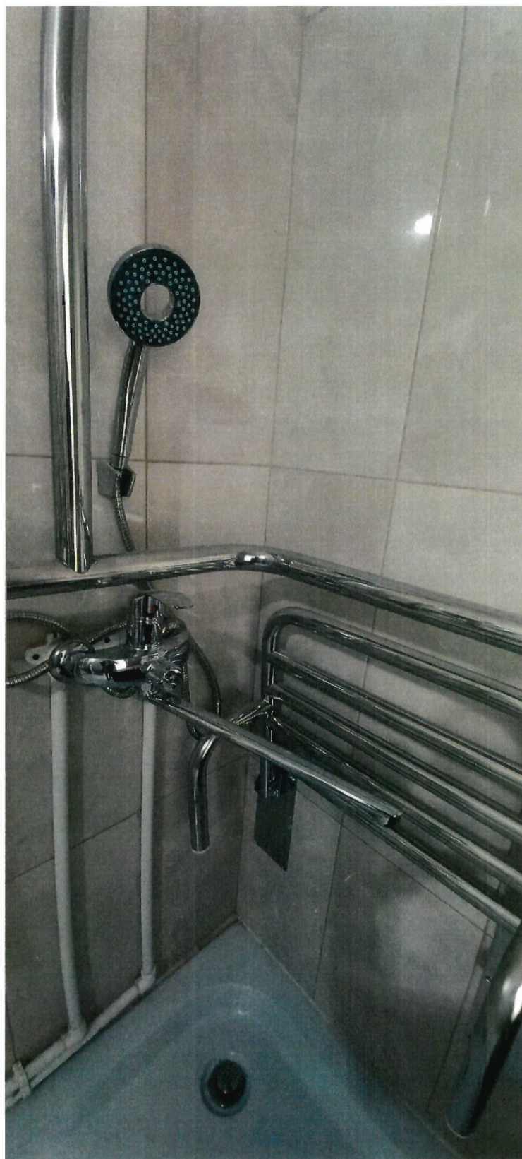
Стены санузла на 2 этаже облицованы новой плиткой